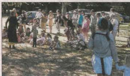
LA PRINCESSE EST MALADE. La saison culturelle de la communauté de communes du Pays de Mauriac.