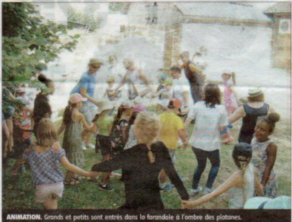
ANIMATION. Grands et petits sont entrés dans la farandole à l'ombre des platanes.

partie de la programmation nationale de Lire en Fête, pilotée par le Centre