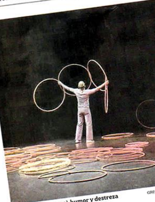
Topido (Ou l'inverse), humor y destreza