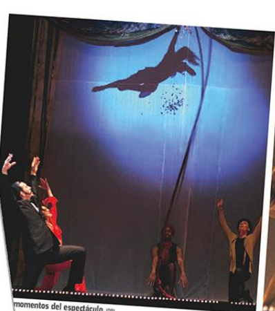
momentos del espectáculo.

Un grupo de intervención urbana recorrió distintos puntos de la vía pública solicitando a las personas a su paso e invitando a diferentes escenarios. Además, fue una delirante propuesta gratuita (con todas las nacionalidades) que se presentó el sábado pasado, por ejemplo, alrededor del lago de Palermo y luego en el Museo Sivori con una aventura que narra las peripecias de