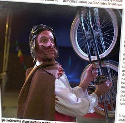
pe hétéroclite d'une parfaite maîtrise dans le spectacle Circo Teatro Gaucho.

3, rue Clavel, 75019 Paris. Uniquement les dimanches (jusqu'au 1 er décembre), à 17 h 45. Rés. : 06 63 58 09 37 ou asso.circocriollo@gmail.com