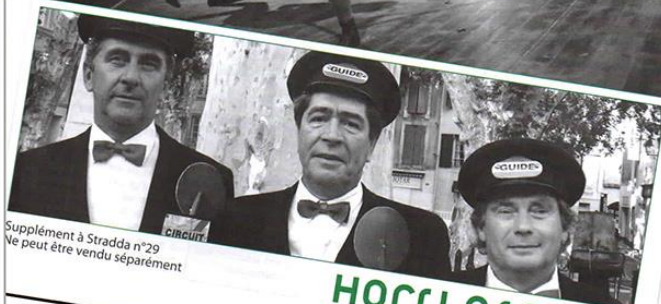
Supplément à Stradda n°29 Ne peut être vendu séparément