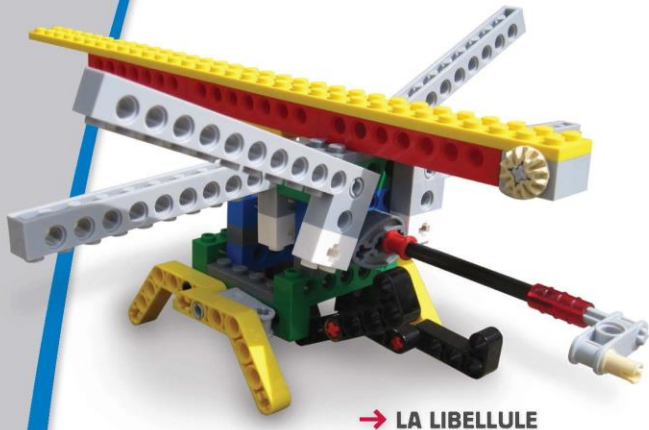
→ LA LIBELLULE