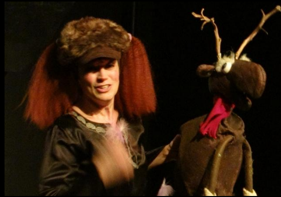
Etienne, le Vieux Renne & La Petite Fille de Brigands