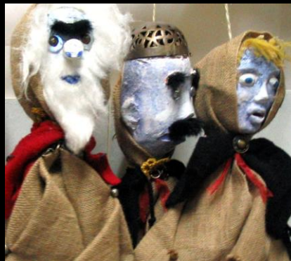
Vide-Gousset, Forban & Canaille : les Brigands poltrons et la Mère Brigand