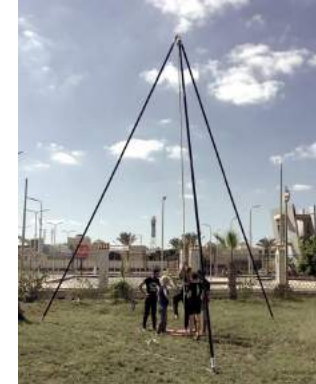
Vus de face