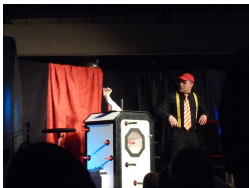
Ballon géant, 1/2finaliste Belgium'sgot Talent