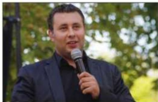
Sa rencontre avec Laurent Gerra a été déterminante.