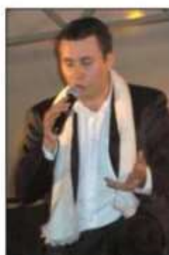
Guillaume Ibot a en projet un spectacle hommage à Joe Dassin.

Ses projets dans l'avenir : « un spectacle hommage à Joe Dassin, plus intimiste, pour le 35 e anniversaire de sa mort en automne 2015, continuer à vivre de sa passion, à essayer d'apporter de la bonne humeur aux gens... et peut-être un petit passage à la télévision... ».