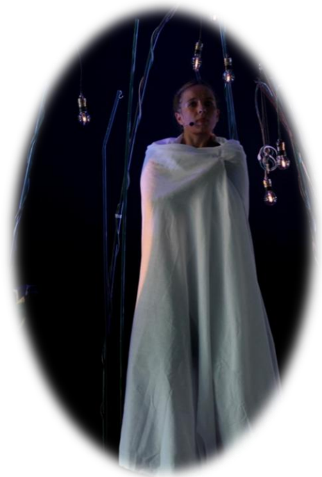
La petite impératrice