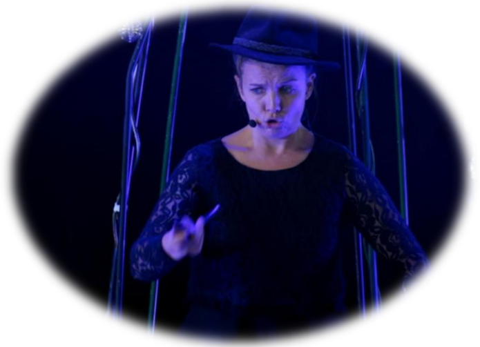
Le libraire, Mr Koreander