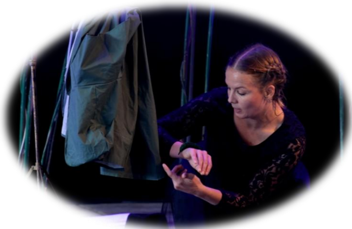
Le petit elfe nocturne, une chenille couverte de poils