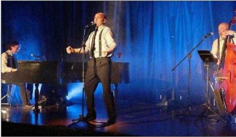
Le trio Swing'n'Zazou a distillé la fantaisie de la chanson française mélangée à l'énergie du jazz.