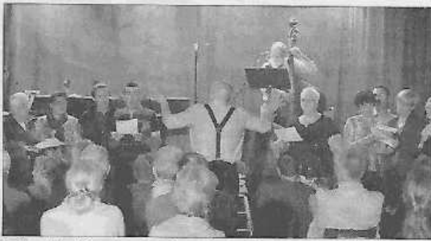
La chorale de Mainxe, accompagnée par les musiciens du trio Swing N'Zazou et le chanteur en chef d'orchestre ont été très applaudis.