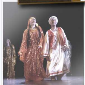
Danse Nubiennne Bab al Noujoum en 2016