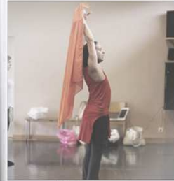
Entraînement Troupe YaNawaem en 2016