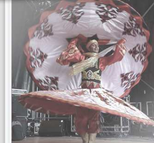
Tanoura Luxembourg en 2014