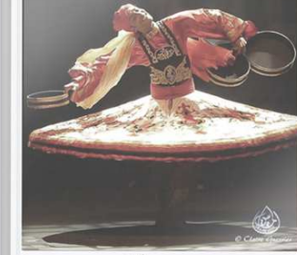
Tanoura La Cigale à Paris en 2015