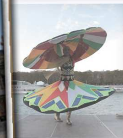
Tanoura Paris en 2017