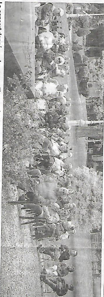
Le concert donné par le groupe "La rue des bons enfants" et organisé par les Thermes et l'office de tourisme.