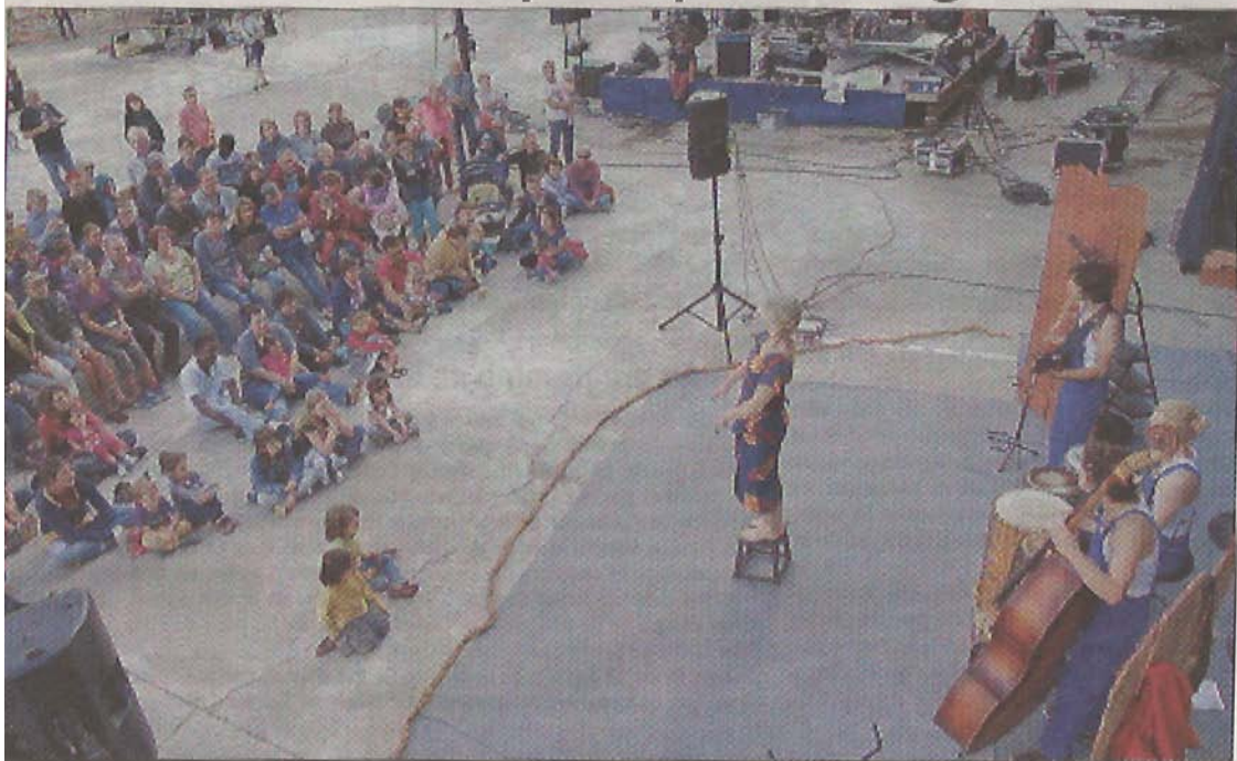
SPECTACLE. La compagnie uzerchoise avait déplacé la foule lors de sa prestation dans la Perle du Limousin.

Depuis le début de l'année 2014 on entend parler du fameux Loup de Tombouctou . Un conte musical né de l'association P'tits Bouts & Cie, domiciliée dans la Perle du Limousin.