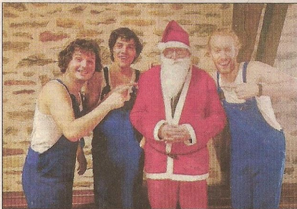
POÉSIE ET HUMOUR. Un conte interprété avec beaucoup de tendresse par P'tits Bouts et Cie.