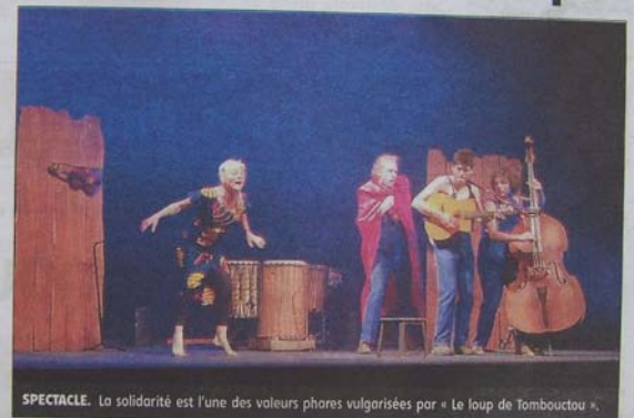
SPECTACLE. La solidarité est l'une des valeurs phares vulgarisées par « Le loup de Tombouctou ».

Des références aux contes connus de tous, ponctuent la représentation. Le