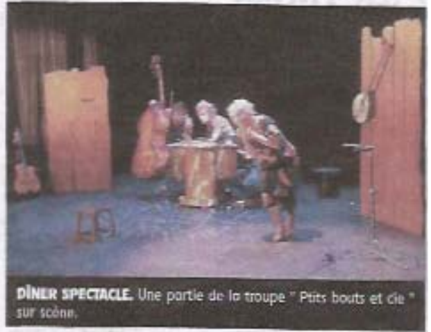
DINER SPECTACLE. Une partie de la troupe " P'tits bouts et cie " sur scène.