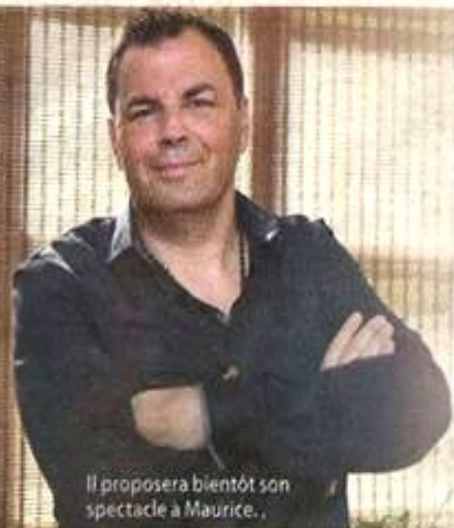
Il proposera bientôt son spectacle à Maurice.

En attendant de découvrir son show, «No limit, ouvrez votre imaginaire», mêlant humour et frissons, durant lequel les spectateurs deviennent eux-mêmes acteurs. Cet artiste, qui maîtrise l'art de l'hypnose, vous ouvre les portes de son univers. Restez concentré car il peut très vite prendre possession de votre subconscient et vous... téléguider avec sa voix !