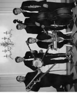
RTO 2007 - Château de Saint-Haon

Le quintette a aussi la particularité de chanter ce qui rend son concert très vivant