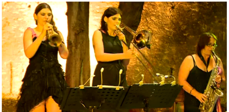
Les What Elle's aux Soirées Estivales 2016

Mis à jour le 13/07/2016 à 17H46, publié le 13/07/2016 à 17H45