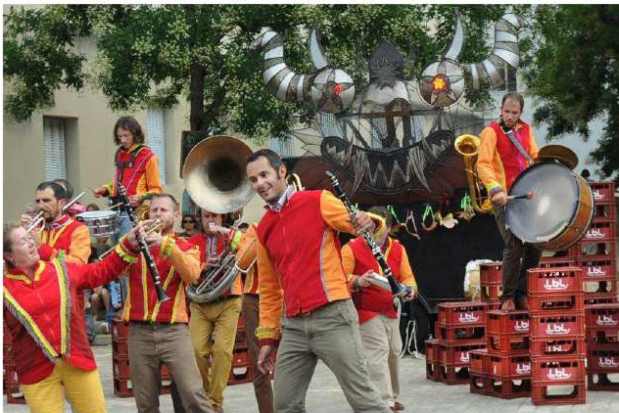
Después... par Belle Image.

Les instruments rangés par famille harmonisent leurs notes sur des rythmes latinos-roots. La fanfare Belle image a le sang chaud musical, mélange de sonorités espagnoles et sud-américaines. Difficile de résister à l'ambiance festive dictée par Después... Ces musiciens ne boudent pas leur plaisir de jouer ensemble. La fanfare offre un spectacle aussi joli à entendre qu'à voir puisque ses membres orchestrent une véritable chorégraphie endiablée à partir de caisses de boisson.