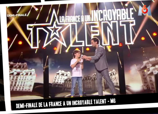
DEMI-FINALE DE LA FRANCE A UN INCROYABLE TALENT - M6