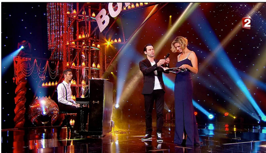
Le 31 Décembre 2014, au Plus Grand Cabaret du Monde sur France 2.