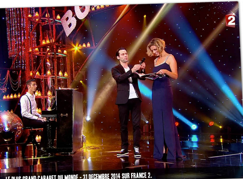
LE PLUS GRAND CABARET DU MONDE - 31 DECEMBRE 2014 SUR FRANCE 2.