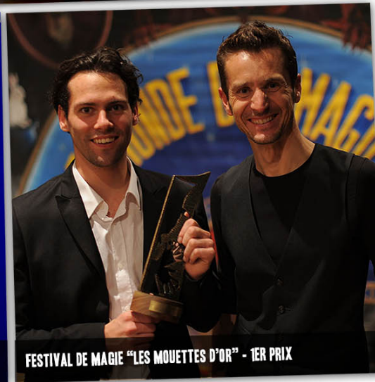
FESTIVAL DE MAGIE "LES MOUETTES D'OR" - 1ER PRIX