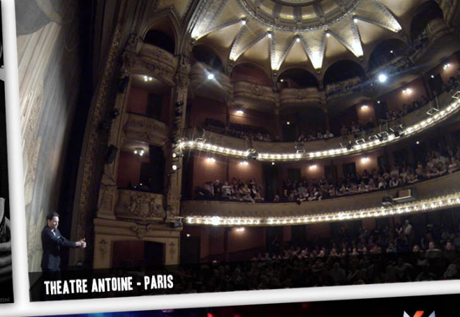
THEATRE ANTOINE - PARIS