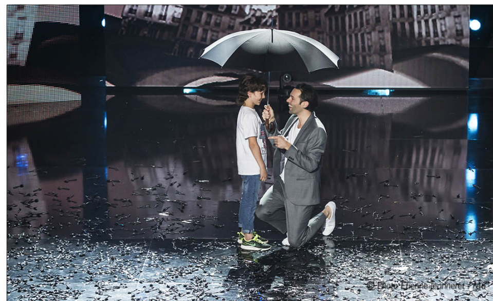
Le 29 Novembre 2016, Demi-finale de la France a un Incroyable Talent sur M6.