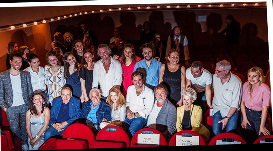
SOIREE DE GALA DE L'ENTREE DES ARTISTES - ECOLE DE THEATRE ET DE CINEMA DIRIGEE PAR OLIVIER BELMONDO.