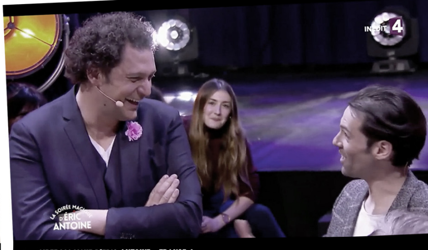
LA SOIREE MAGIQUE D'ERIC ANTOINE - FRANCE 4