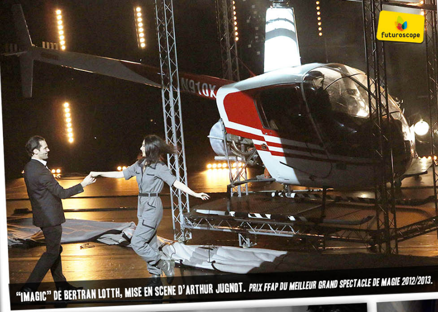
"IMAGIC" DE BERTRAN LOTH. MISE EN SCENE D'ARTHUR JUGNOT. PRIX FFAP DU MEILLEUR GRAND SPECTACLE DE MAGIE 2012/2013.