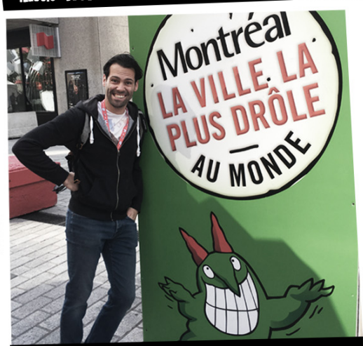
JUSTE POUR RIRE - MONTREAL