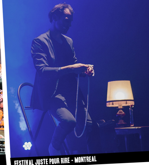
FESTIVAL JUSTE POUR RIRE - MONTREAL