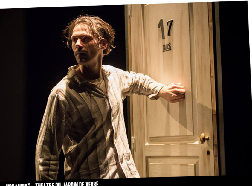
"GRANDIR" - THEATRE DU JARDIN DE VERRE