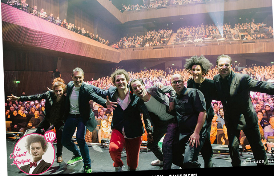
LE CABARET MAGIQUE D'ERIC ANTOINE - FESTIVAL D'HUMOUR DE PARIS - SALLE PLEYEL