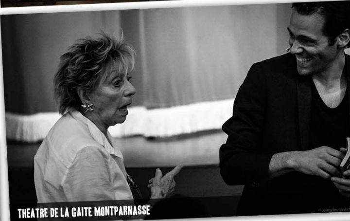
THEATRE DE LA GAITE MONTPARNASSE