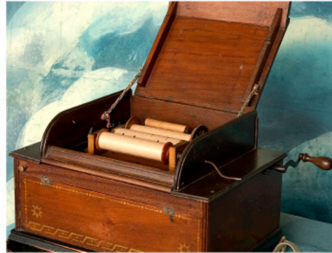
Séraphone orgue à anches libres