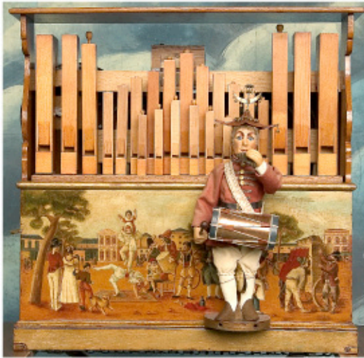
27 Erman orgue à flûtes