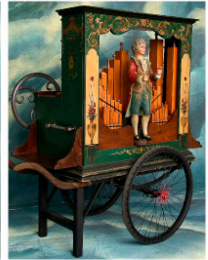
42 Odin orgue à flûtes

Pierre a réuni au cours des années un instrumentarium : quatre machines musicales dont il s'accompagne tour à tour, trois orgues de barbarie, et une boite à musique, instrument unique inventé et fabriqué par lui-même, pour lequel il conçoit les arrangements musicaux sur bandes perforées.