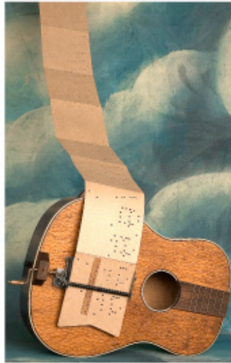
boite à musique, invention personnelle