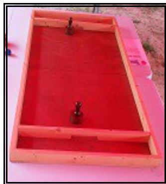
JEUX GÉANTS EN BOIS